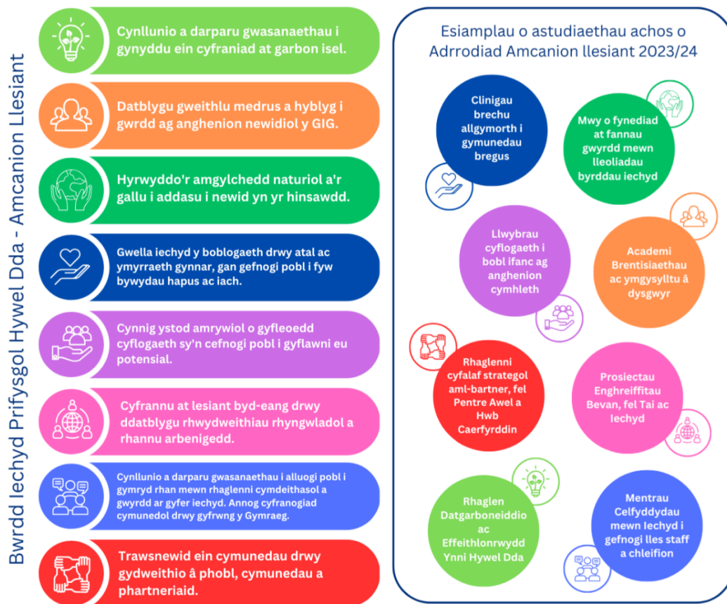
Ffigur 2: Amcanion Llesiant ac enghreifftiau Astudiaethau Achos BIPHDD, Adroddiad Blynyddol Amcanion Llesiant 2023-2024

Amlinellodd ein Hadroddiad Llesiant diweddaraf (2023-2024) ein Hamcanion Llesiant gydag enghreifftiau astudiaethau achos i gefnogi pob amcan ac fe'u darlunir fel Ffigur 2.